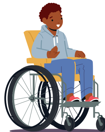
Dans la Maison de la Petite Enfance d'Enghien-les-Bains rassemblant trois crèches en délégation de service public.

À la crèche, les enfants apprennent d'ailleurs la langue des signes aux côtés d'une collaboratrice, elle-même malentendante. Une sensibilisation des enfants, à un âge où tout est naturel, pour ancrer le vivre-ensemble et le respect des singularités, afin de participer au changement du regard porté sur le handicap dans la société.