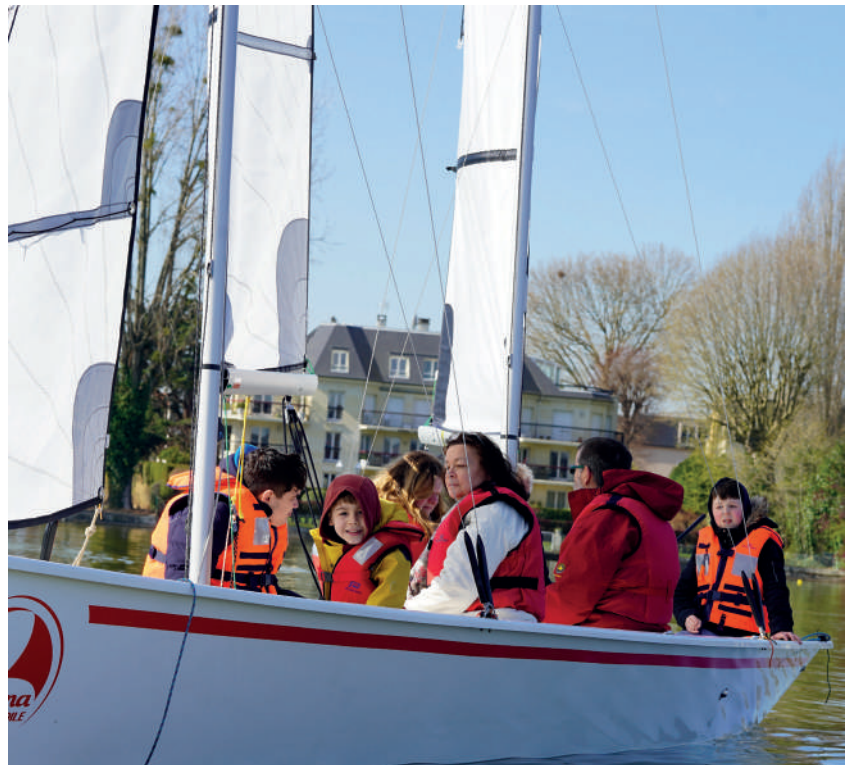
La nouvelle goélette acquise par la Ville rejoint la flotte adaptée à la handivoile pour accueillir davantage d'enfants porteurs de handicap.

L'association ELHAN propose la possibilité de cofinancer les cours