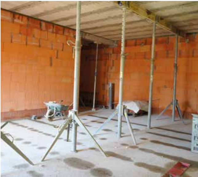
Les maçonneries sont érigées en brique porotherm. Les alvéoles de la brique constituent un vide d'air et donc une isolation thermique naturelle et pérenne.

3 nouvelles classes et 2 salles de restauration