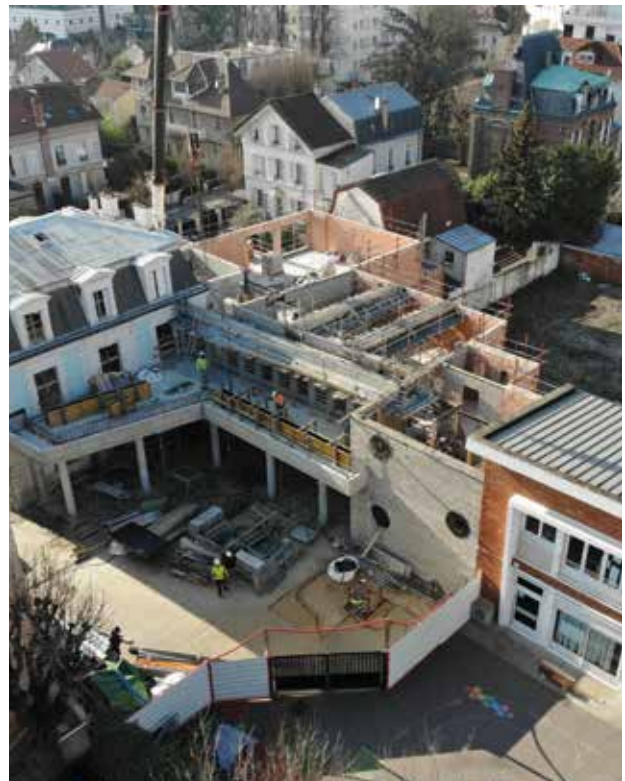
Élévation des maçonneries, coulage béton des poteaux et de la structure porteuse.