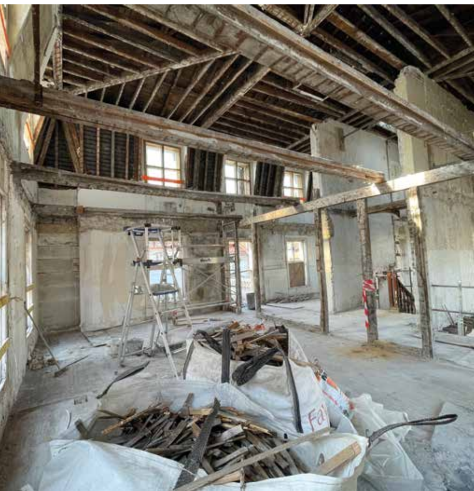
La Villa Bleue a été évidée de ses cloisonnements et planchers intérieurs pour adapter entièrement sa structure aux exigences réglementaires contemporaines et aux fonctionnalités attendues sur un équipement recevant du public.

Les futurs volumes de l'école se dessinent. Derrière la cour de récréation, les travaux d'agrandissement, lancés à l'été 2022, avancent à une allure soutenue. Point d'étape sur l'un des chantiers majeurs de l'année et un engagement de l'équipe municipale.